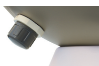
Vidange eau + socle amovible