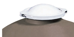
Dôme à bride

Utiliser de préférence le sable Aqualux ou Zeolithe.